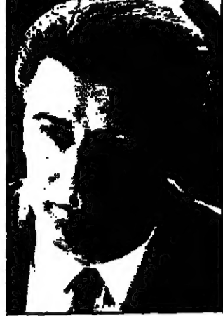
الراهب والكاهن في دور لوسي العام